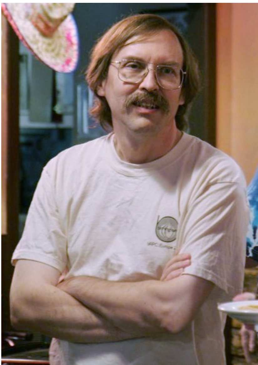
Ларри Уолл (Larry Wall)